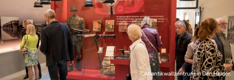
Atlantikwallzentrum in Den Helder.