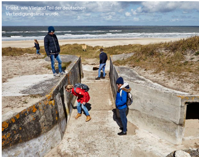
Erlebt, wie Vlieland Teil der deutschen Verteidigungslinie wurde.

Lange Zeit war dieses „etwas unangenehme“ militärische Kulturerbe verwahrlost oder diente als Stall, Lagerraum oder Ferienhaus. Erst in den letzten Jahren wurden vielerorts Teile des Atlantikwalls zugänglich und erlebbar gemacht. Geht auf eine spannende Erkundungstour entlang dieser Orte in Noord-Holland und Friesland und entdeckt die Geschichten hinter diesem faszinierenden Kulturerbe.