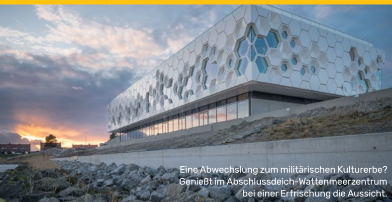
Eine Abwechslung zum militärischen Kulturerbe? Genießt im Abschlussdeich-Wattenmeerzentrum bei einer Erfrischung die Aussicht.